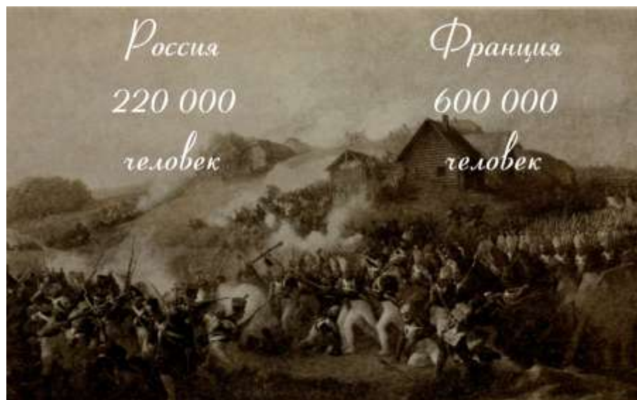
Слайд 1. Соотношение сил Россия-Франция перед началом войны

Учитель демонстрирует слайд, где указано соотношение сил Россия-Франция перед началом войны.