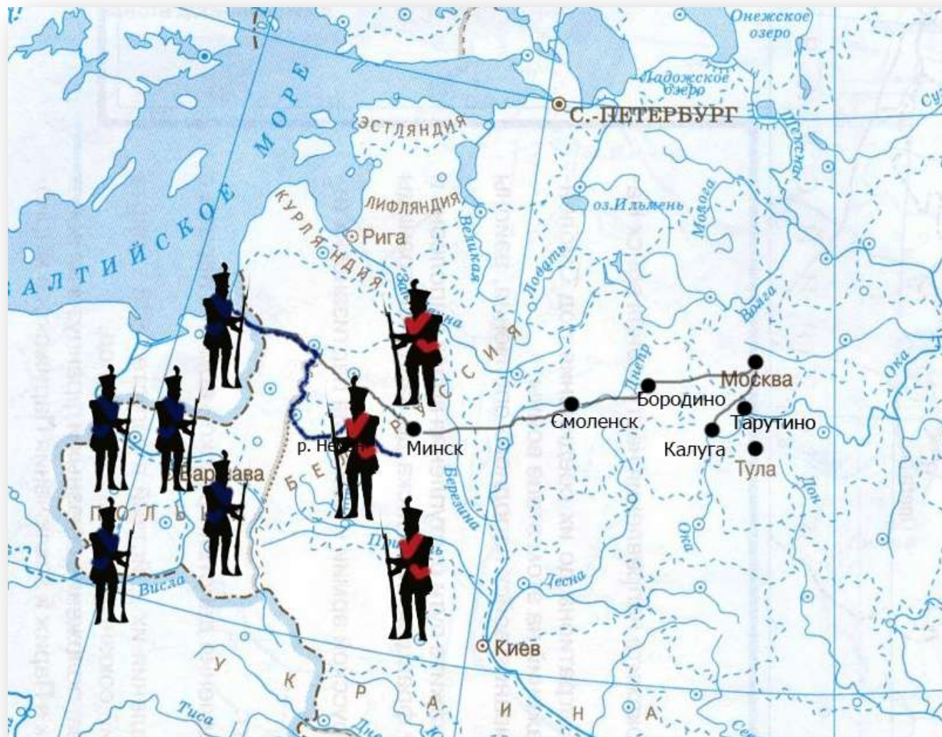
Карта для рефлексии