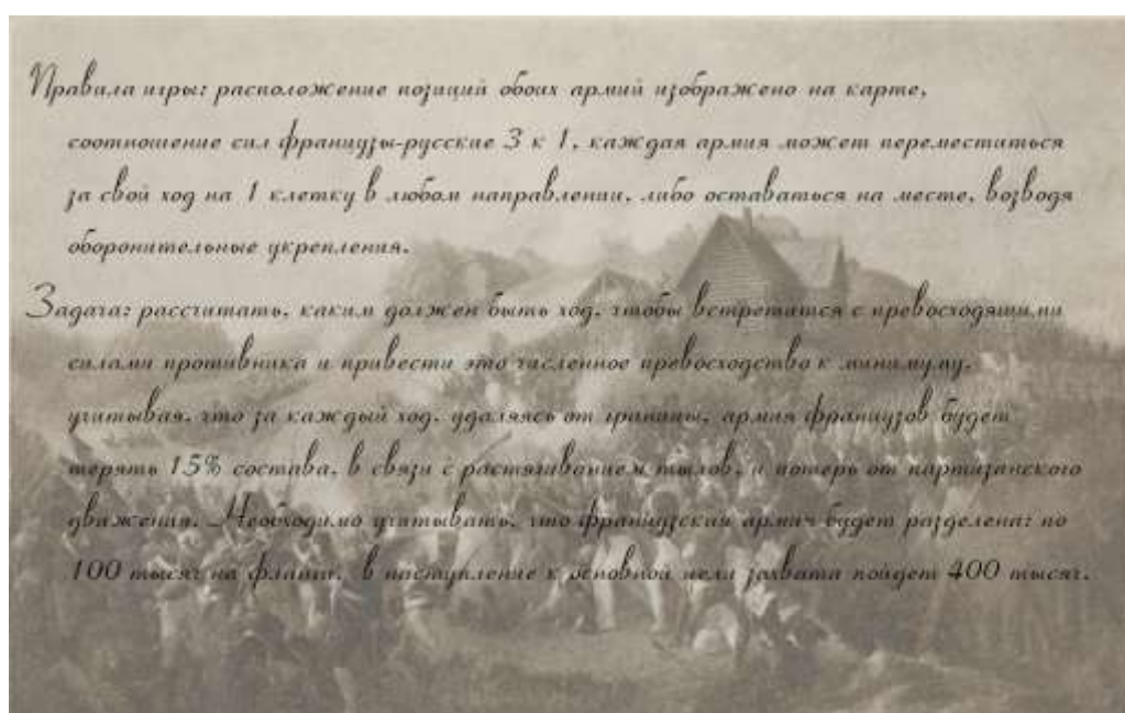
Слайд 4. Правила игры

Всем учащимся предлагается посмотреть на схематическое изображение расстановки вооруженных сил французской и русской армии, и решить тактическую задачу на карте с гексагональной сеткой, привлекая свои знания по математике. Дети разбиты на 5 групп. Каждой группе выдана карта и маркеры обозначения войск и оборонительных укреплений (Приложение 1)