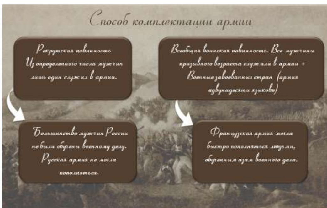
Слайд 2. Способ комплектации армий

Учитель показывает слайд, где демонстрируется способ комплектации армий.