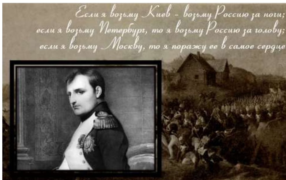
Слайд 3. Портрет Наполеона.

Учитель: Подумайте над этой фразой и скажите – почему российская армия была разделена на 3 части?