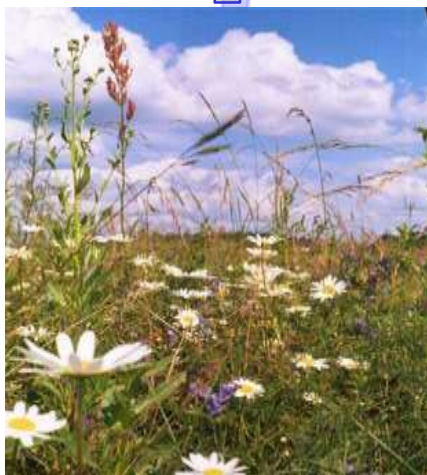
↓ луговые травы