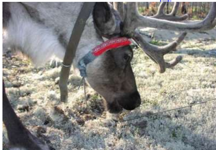
↓ пастбища для оленей