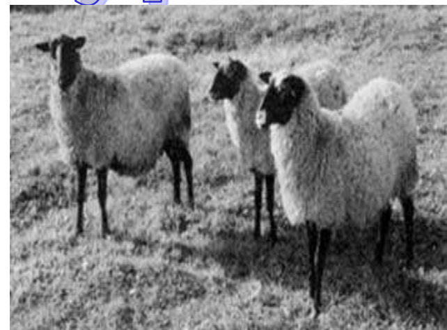
↓ пастбища для овец и верблюдов