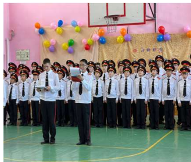
«Ученики – учителям Всегда мы благодарны вам!»

А в МБОУ СОШ № 98 (г. Краснодар) в течение дня вместо звонков звучали добрые песни про школу, на переменах работал открытый микрофон и каждый желающий мог поздравить педагога по школьному радио.